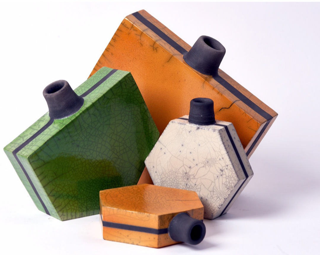
Kate Kanstrup Seks-kantede dunke Rakubrændt, pladeteknik